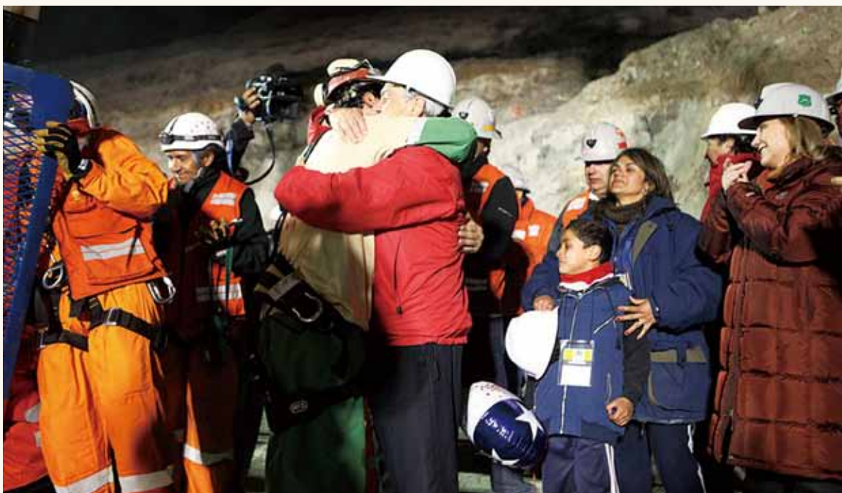
③ 礦工搭乘「鳳凰號」獲救返回地面與總統興奮擁抱。

國際合作是指不同國家或組織之間，透過雙邊或區域往來方式，結合人員、技術、經費的合作，彼此相互支援，以達成特定的目標。國際合作不限於兩個國家之間，或許是經濟利益考量，也可能是社會公益之考量或其他特定的目的。國際合作一定會有彼此共同認同之目標，例如各國對智利提供大量技術及儀器、機具等援助，共同目標即是救出受困於地底下的 33 名礦工。